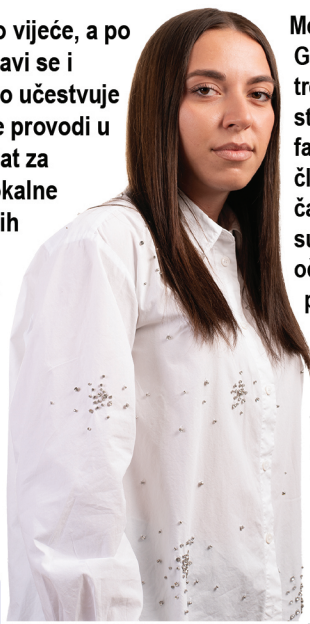
7 Melisa Bahić

Dževad Džodžaljević je kandidat za Gradsko vijeće, a po zanimanju je CNC programer. Pored toga, bavi se i uživa radeći razne vrste marketinga. Aktivno učestvuje u društvenim projektima i slobodno vrijeme provodi u prirodi i sportskim aktivnostima. Kao kandidat za gradsko vijeće, zalagaće se za poboljšanje lokalne infrastrukture, razvoj obrazovnih i kulturnih institucija te podršku malim preduzećima. Smatra da sistematizacija mora ući u sve ključne sektore i da se na odgovorne pozicije moraju postaviti stručni ljudi istinski željni promjena na bolje kako bi sve bolje funkcionisalo. Njegov cilj je stvaranje boljih uslova za život svih građana Gradačca kroz transparentnost i odgovornost u radu vijeća.